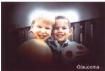
การมองเห็นของคนเป็นต้อหิน