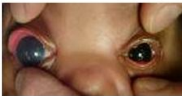
ต้อหินอาจพบในเด็กเล็กได้โดยจะมีตาโต และกระจกตาขุ่น

โดย... รศ.นพ.นริศ กิจณรงค์ ภาควิชาจักษุวิทยา